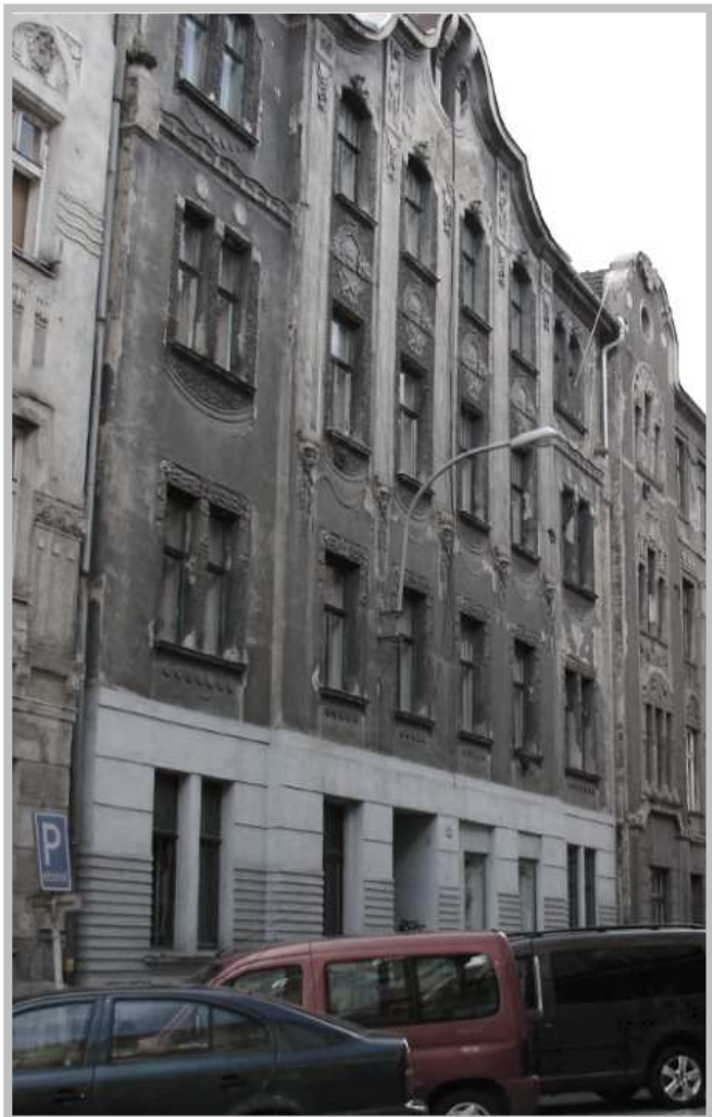
ULIČNÍ FASÁDA – VLHKÁ 20 ÚPRAVA OKENNÍCH OTVORŮ PŘÍZEMÍ

V rámci revitalizace bytového domu Vlhká 20 v Brně byla provedena obnova uliční historické fasády, výměny oken, zateplení fasády dvorní, úpravy zpevněných ploch dvoru, změna systému vytápění v bytech na plynové ÚV.